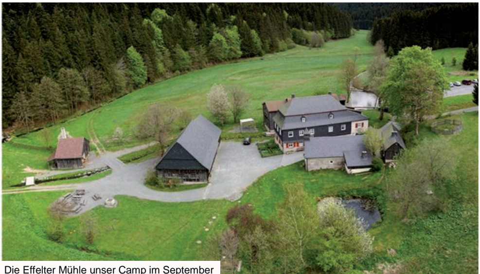
Die Effelter Mühle unser Camp im September