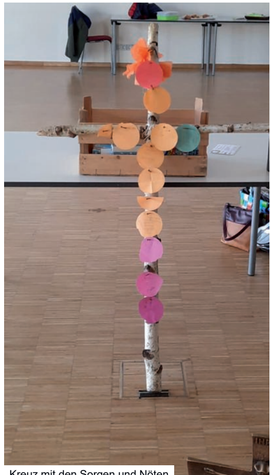
Kreuz mit den Sorgen und Nöten