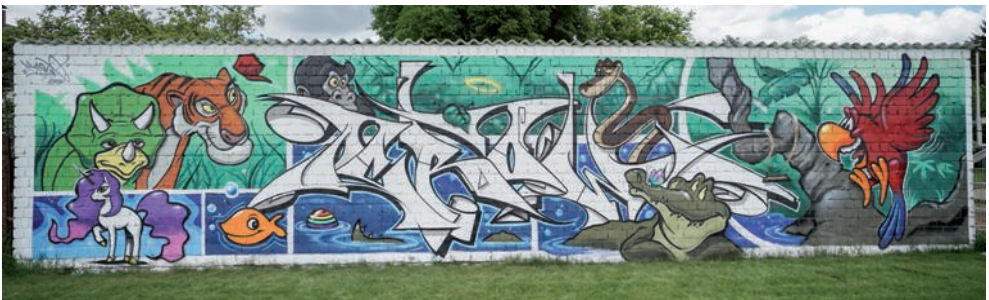
Die fertig gestaltete Wand